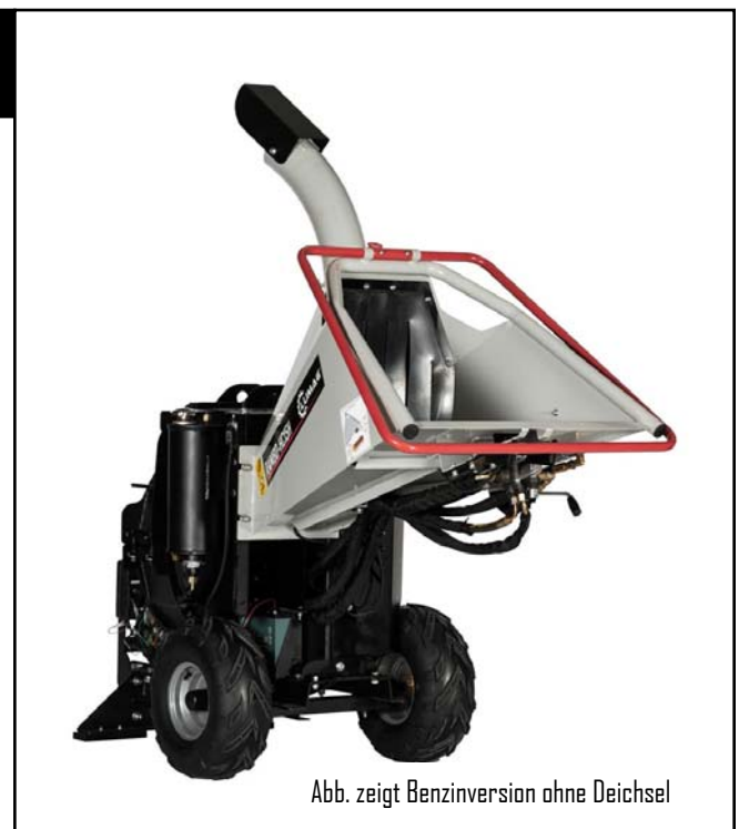
Abb. zeigt Benzinversion ohne Deichsel