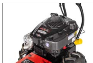
BRIGGS & STRATTON Motor